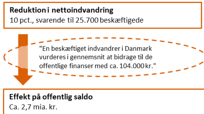
Figur 3 Effekt af reducerer nettoindvandring på de offentlige finanser, et regneeksempel

Anm.: Effekter er i 2017-priser. Bidrag til de offentlige finanser er renset for betydningen af midlertidige (særlige) forhold i 2014 efter samme principper som den strukturelle saldo, dog ekskl. korrektion for konjunktur.