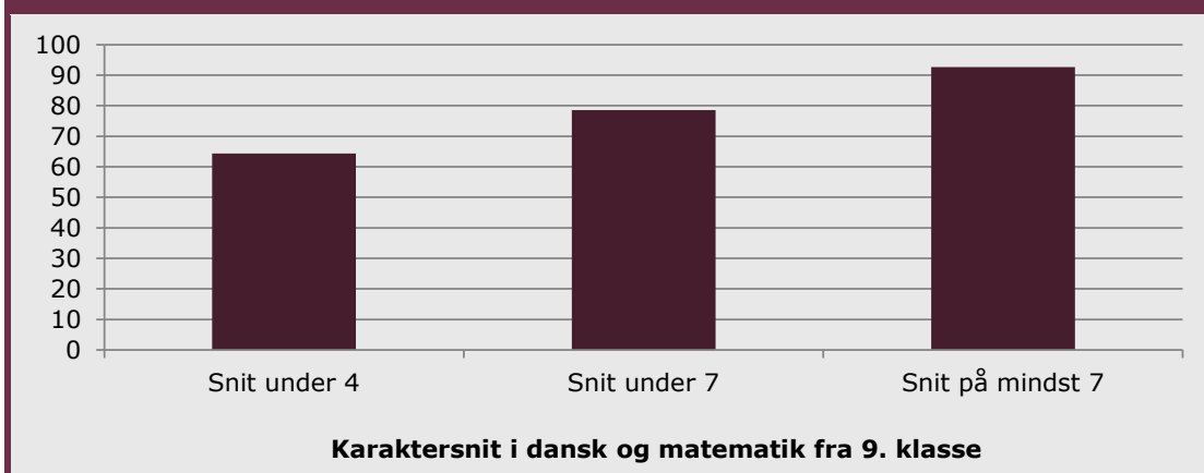
Figur 1: Gennemførelsesprocent på de gymnasiale uddannelser fem år efter start for de unge, der startede i 2004 (pct.)